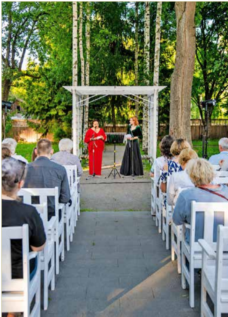
Высоким слогом русского романа.

А вы, уважаемые читатели, знаете ли, допустим, такую иностранную забаву XIX века, как