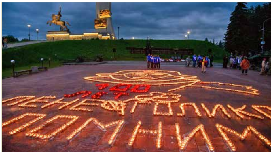
Акцию «Огненные картины войны» посвятили также столетию со дня рождения юного партизана Лёни Голикова.

В Старой Руссе вереница белых журавлей, выложенная лампадами, словно