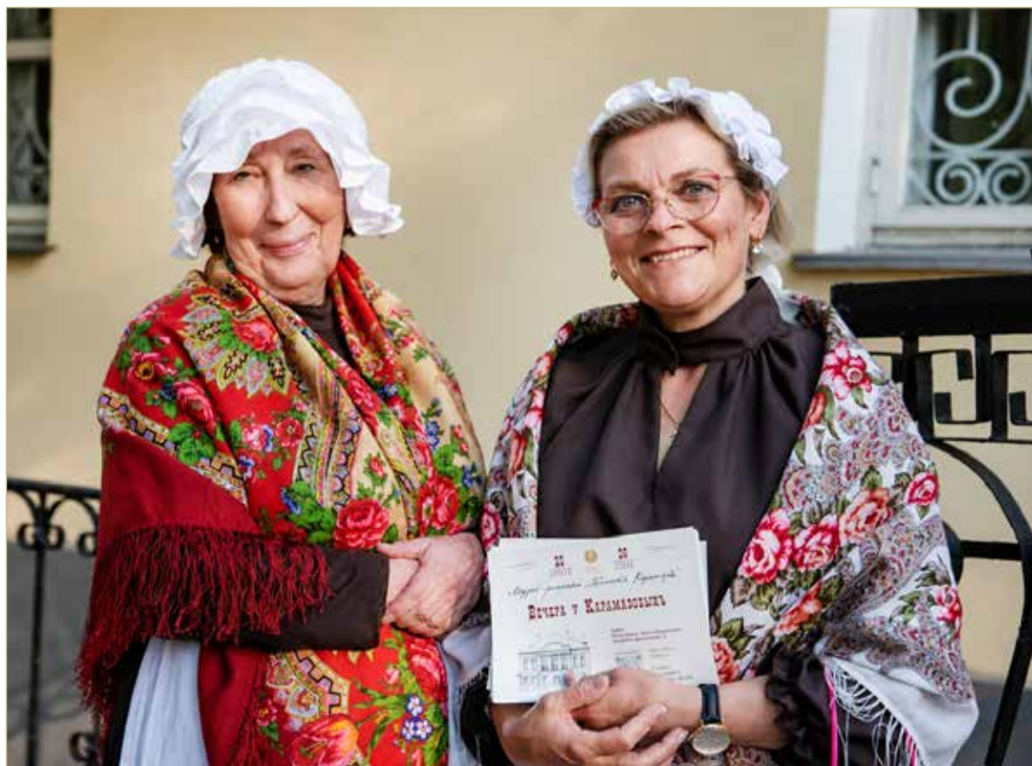
Сотрудникам музея часто говорят, что они будто вышли из той эпохи.