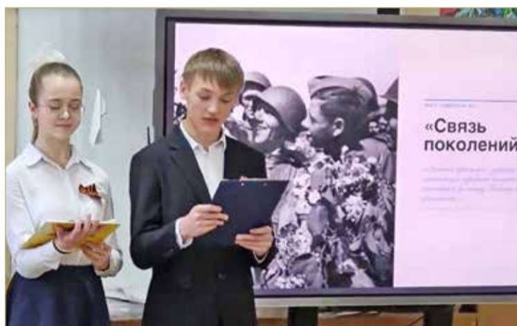
На главном празднике страны.