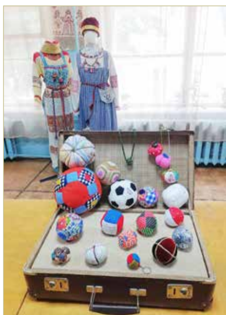
Уже этой осенью все желающие смогут увидеть большую коллекцию русских мячиков.