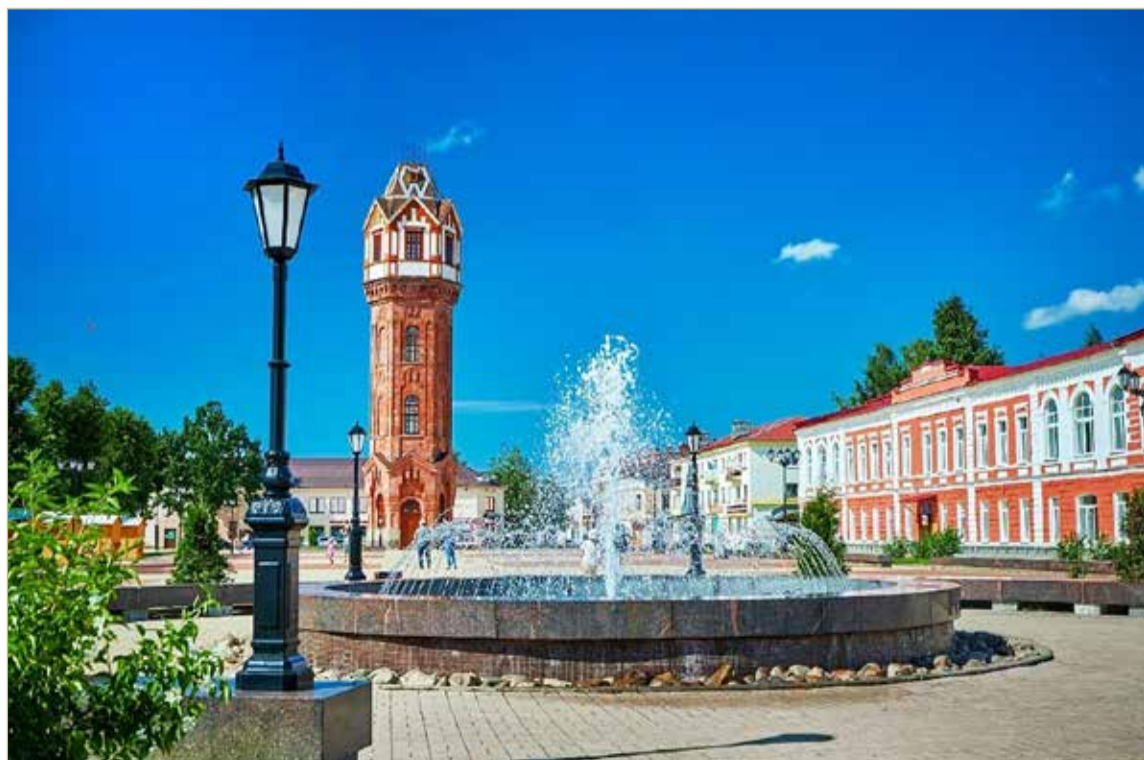
Сотни лет назад представители некоторых профессий в Старой Руссе старались селиться на одних и тех же улицах.

Историки собираются расширять карту профессий и добавят на неё представителей главного старорусского промысла — солеваренного. Сейчас они наносят на карту варницы и места жительства тех, кто на них работал. Такую же работу проведут с торговыми рядами и торговцами. Мастеров в Старой Руссе было много. Хватит как минимум на одну диссертацию.