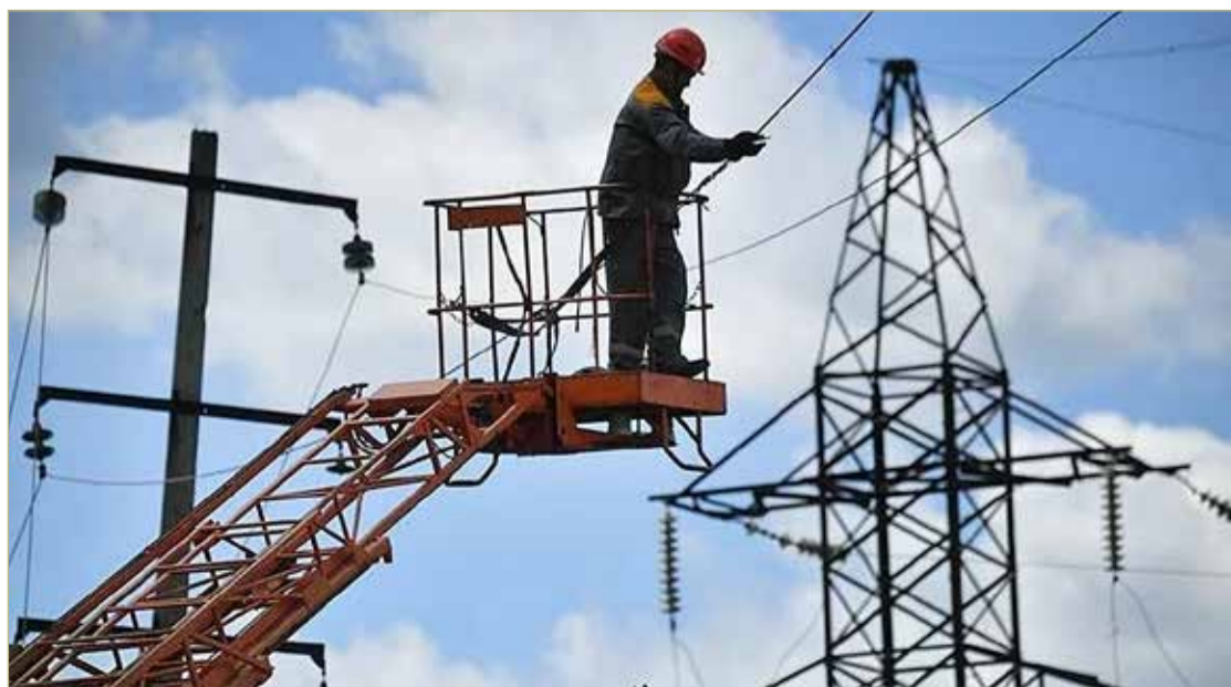
С 2022 по 2025 год число аварий на электросетях региона выросло в 2,2 раза.

А ещё завершившееся голосование показало, что жители региона неравнодушны к облику своих городов, посёлков и деревень. Масштабная поддержка благоустройства общественных пространств – это не просто цифры в протоколах, а реальный запрос на качественные изменения.