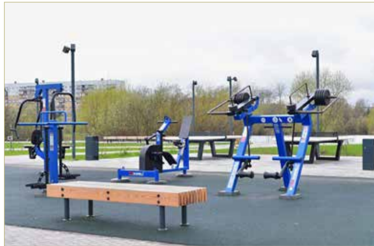
Парк «Чистые пруды» одержал в голосовании уверенную победу.