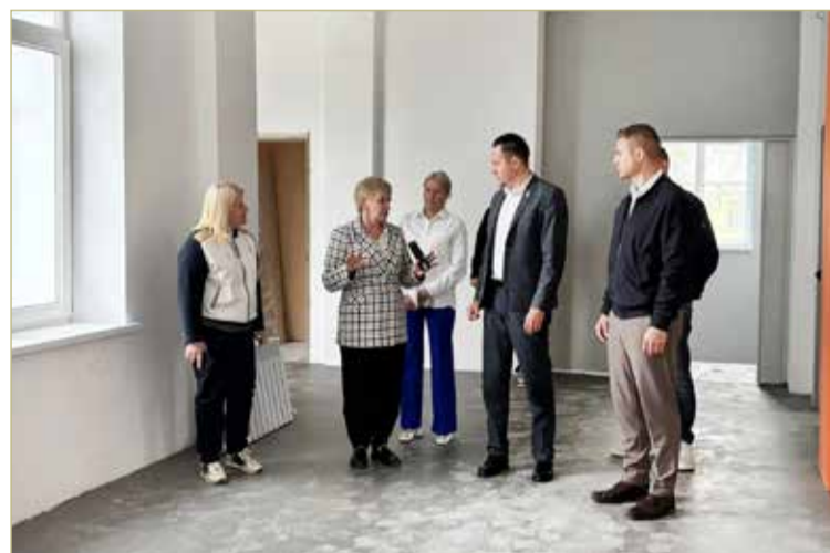
Капремонт школы должен завершиться к 1 августа 2026 года.

Министр сообщил, что в Тёсово-Нетыльской средней школе обучается более 230 ребят, из них 80 – в начальной школе. Руководитель ведомства отметил, что уже в сентябре дети и педагоги вернутся в обновлённое здание. В рамках федеральной программы предусмотрено оснащение кабинетов совре-